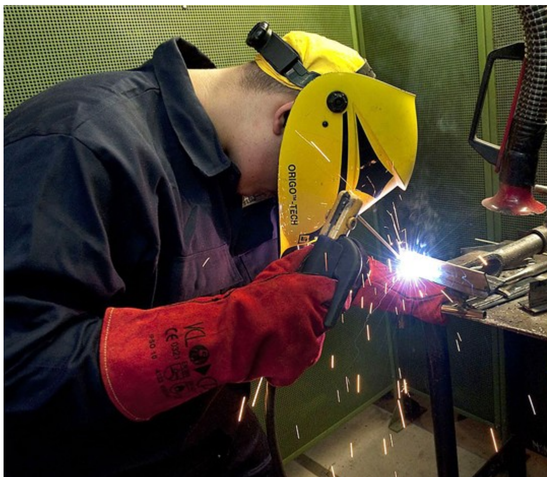
In België werd de EN287-1:2011 in september 2011 reeds overgenomen